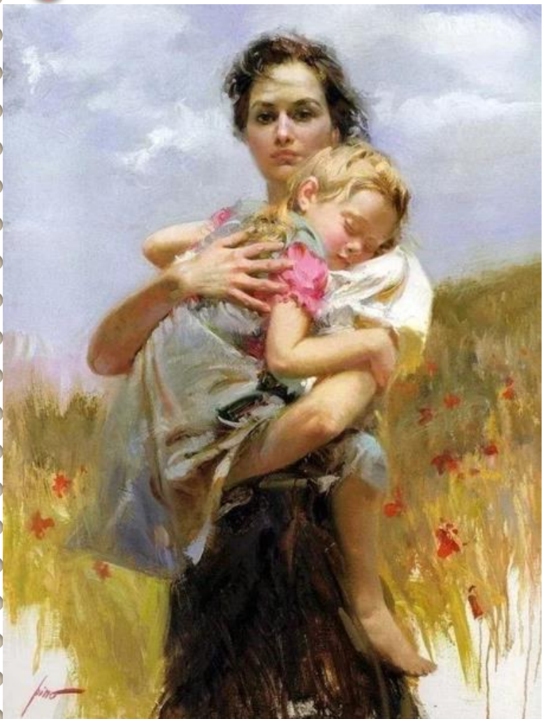
«Мать и Дитя», Художник Пино Даени