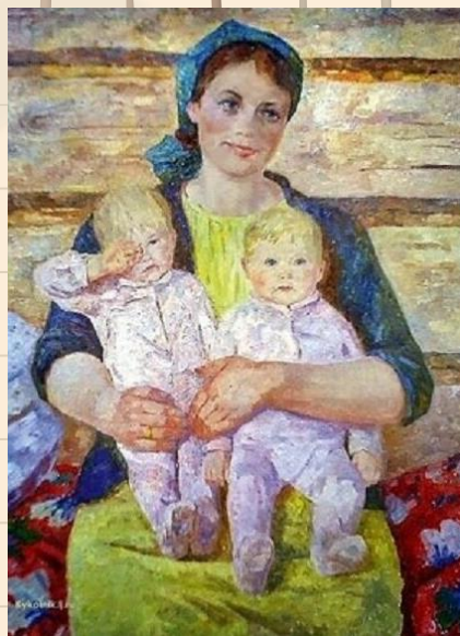
«Близнецы», Художник Вениамин Борисов