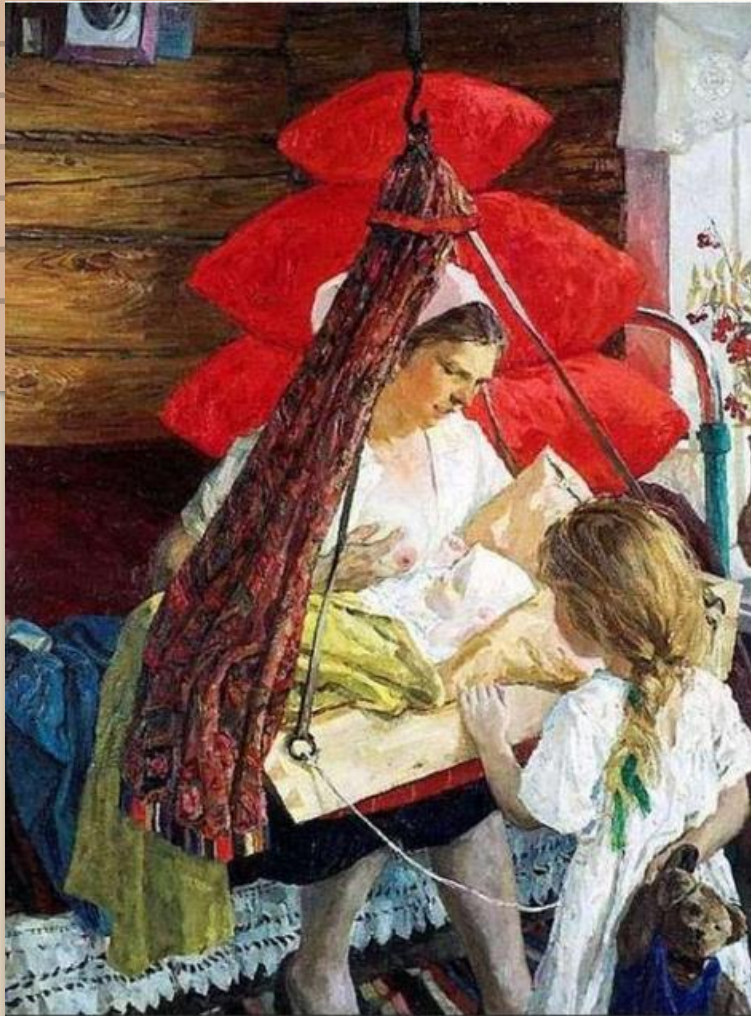
«Мама», художник Аркадий Пластов

Любовность и материнство почти исключают друг друга. Настоящее материнство — мужественно.