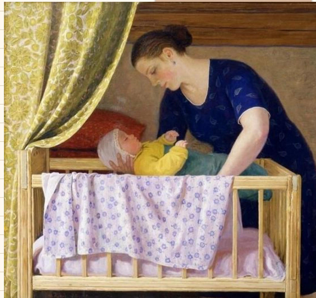
«У колыбели», Художник Юрий Кугач