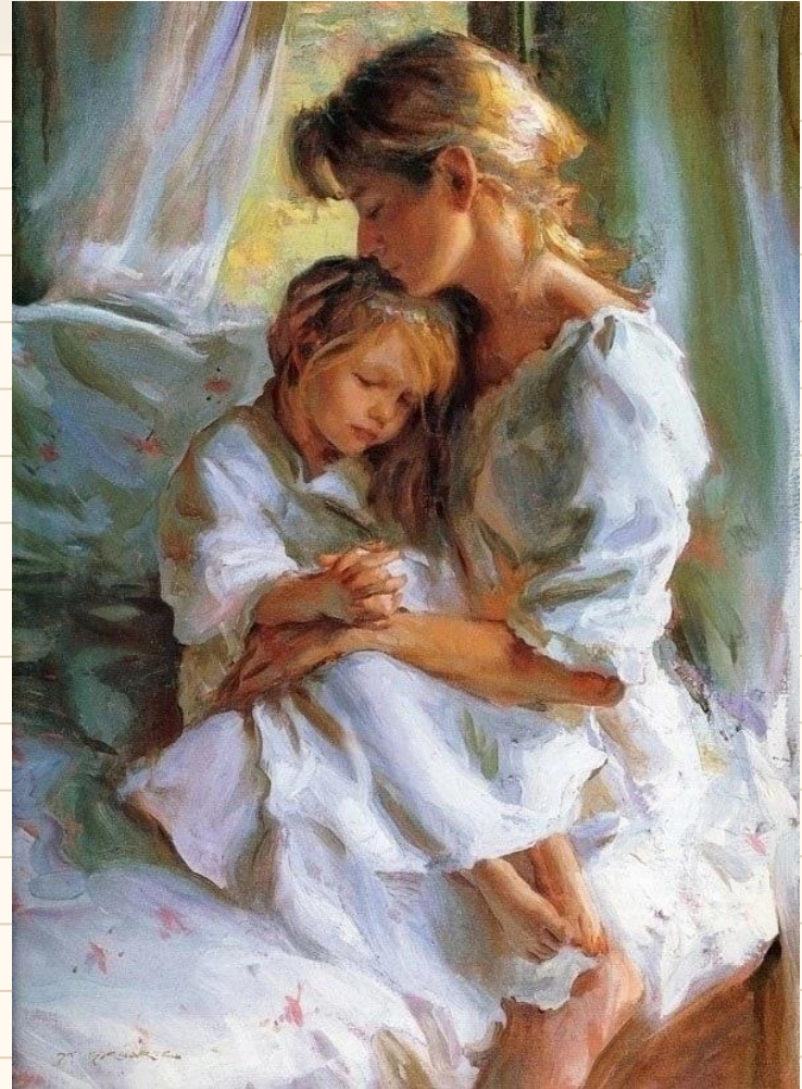
«Мать», Художник Даниэль Герхарц