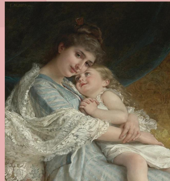
«В нежных объятиях», Художник Эмиль Мунье

"Что может быть на свете священнее имени матери ! Все самые дорогие святыни названы и озарены именем матери , потому что с именем этим связано и само понятие жизни"