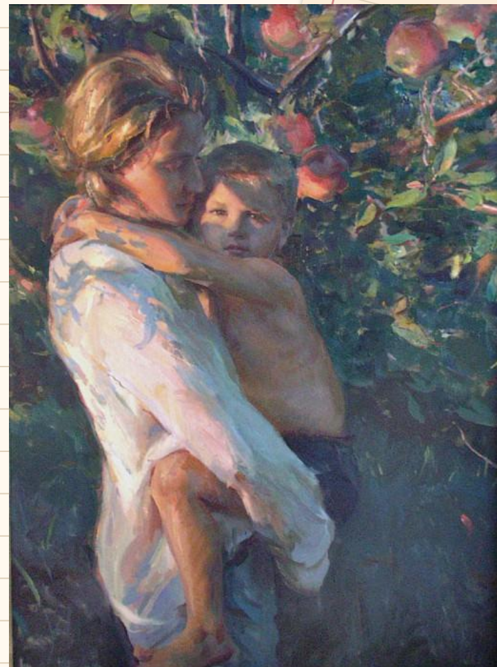
«С мамой», Художник Даниэль Герхардтц