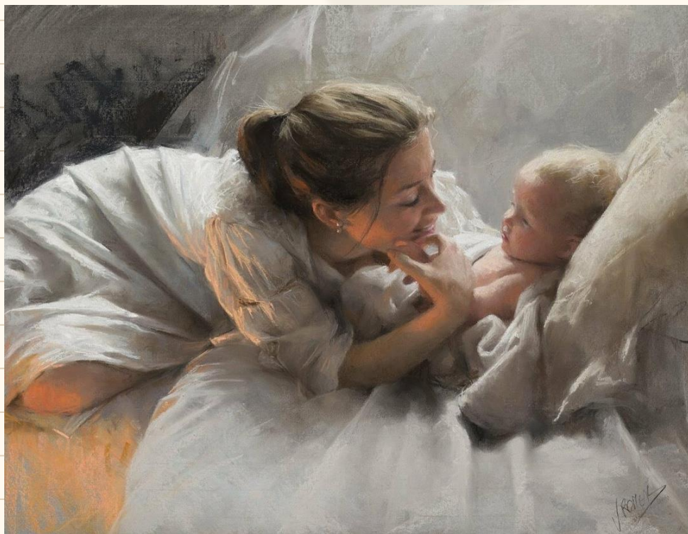
«Мать и дитя», Художник Висенте Редондо

Сердце матери — глубокая бездна, на дне которой всегда найдешь прощение.